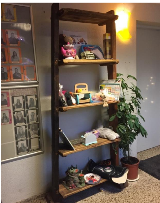
Byttereol fra Baunevangen

Med en byttereol kan tingene få ny ejer og nyt liv. Samtidig giver det mulighed for børnene at reflektere over deres egne ting og hvad det vil sige at genbruge.